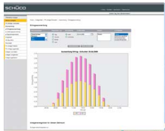
Ansicht der Ertragsauswertung